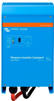
Phoenix Inverter Compact 24/1600

Die Möglichkeiten mit parallel geschalteten Wechselrichtern sind tatsächlich erstaunlich. Vorschläge, Beispiele und Kapazitätsberechnungen können Sie in unserem Buch "Immer Strom" nachlesen. (Kostenfrei erhältlich bei Victron Energy und herunterladbar von www.victronenergy.com ).